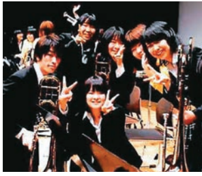
高校時代の吹奏楽部の仲間と