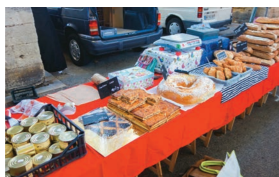
此処も市場の毎週必ず足を運ぶパン屋さん。クルミのお菓子(リング状のお菓子の左隣にあるのがそうです。)が次男の好物で毎土曜日の朝これを大きく切ったものを彼は二切れも一時に食べてしまいます。私はもっぱら黒パンを買うだけです。

ように、パブリカだの茄子だのズッキーニだの一番出回っている夏野菜をトマトソースをベースにしたごった煮、世間では「ラタトゥイユ」と呼んでいるらしいですけど、それを市場から帰ったばかりで野菜の鮮度が落ちない内に大なべで煮て、仕上げにはこれも自分で干して瓶に入れて保管しているハーブをばらばらと振り入れます。ラタトゥイユはこの土地の主婦が自己流にアレンジしてそれぞれの家の味を出す料理らしく、友達の所ではオーブンで焼いた物を出してくれました。兎も角も母子家庭になった私達には食費が安上がりというのはありがたい事でした。