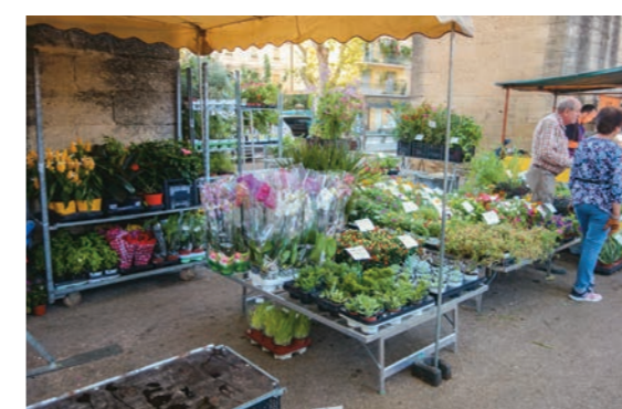
同じく市場の花屋さん。三十年來我が家のバルコニーを飾る花々は皆此処の出身です。

南フランスの朝は窓の外に広がる青空を目にするところから始まります。この地方では天気が良いと言つのは絶対必要条件で、何かの拍子に雨が二日間でも続けて降るものなら、土地の子達は突発性鬱病というか、皆さん酷く憂鬱な気分になられるようです。日本の梅雨を経験し、猪と彼の地で生まれた人以外には耐え難いと言われていたルクセンブルクの悪天候で鍛えられているはずの私でさえも此処での生活