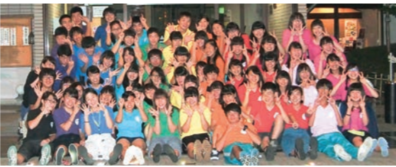
文京高校吹奏楽部

大きく語ってしまいましたが、教員としてはまだまだ未熟で、生徒たちに助けられることばかりです。朝、気持ちいい挨拶を聞くと一日がんばろうという気分になります。 授業への熱心な取り組みを見ると、よい良い授業、より高い力をつけることのできる授業を目指さなくては、と反省させられます。明るい挨拶も、授業への集中力も、また行事や部活動への情熱も、生徒たちの朗らかさも、これらすべてが「文京らしさ」であり、長きに渡って受け継がれているものなの