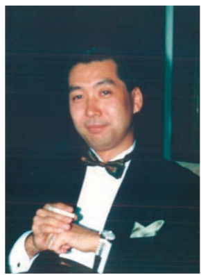
2003年 部下の結婚披露宴にて

にその容量に比例するのではなく、そこに入れた水の量が決まります。高校時代の私のバケツは小さなものでしたが、溢れんばかりに水を入れていたはず。人は学習し経験で、歳と共に能力は上がり、バケツは大きくなります。しかし同じバケツでも、人によってそこに入れている水の量は大きく異なります。学習と経験でバケツはどんどん大きくなります