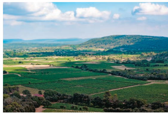
やはり車で約十分ほどの所にあるピック・サン・ルールのブドウ畑。

1981年8月ルクセンブルクから家族と共に南仏モンペリエ市に移住した時、滞在は一年の予定でした。この町の大学の仏語教師養成講座のディプロムを取得したらさっさと日本に帰って、交通事故の後遺症でFIC(現EUI)を傷病退職せざるを得なかった夫に代わって日本で就職し一家の大黒柱にな