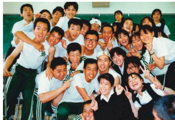
1年D組クラススナップ

り楽しくて、クラスにはあまり貢献できませんでした。文京の思い出はほとんど音楽部の思い出です。部活の仲間とはかり過ぎている感じが、高校に入るまでは合唱は学校の音楽の時間にやるだけで、合唱が好きと思っただことはなかったと思います。たまたま同じクラスで少し話すようになった子が音楽部に見学に行くというのでついて行ったら、先輩方がとても親切だったので、楽しんでいるのが伝わってきました。雰囲気の良いだけで入部したのに、すっかり部活が好きになり、心の拠り所になっていきました。声質はソプラノなのですが、アルトが足りないというので、誰かアルトに移ってほしいといわれて、とくにこだわりがなかったので、アルトになりました。アルトになってみて、主旋律より音をとるのが難しいことがわかりました。楽譜が読めなくても、パー