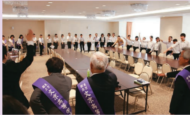
参加者全員で練習