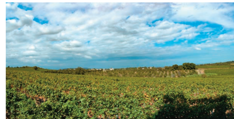
モンペリエから車で約十分ほどの場所にある村、サン・ドレゼリーのブドウ畑。

まれずに自分の選択に従って普通の大学ならばそのまま入学出来ます。しかもフランスでは教育は無償が前提ですので、進学のために親が身代を傾ける必要はありません。夫亡き後の生活はE.Cの手厚い社会保障制度に守られ、贅沢を望まなければ何とか暮らして行けました。