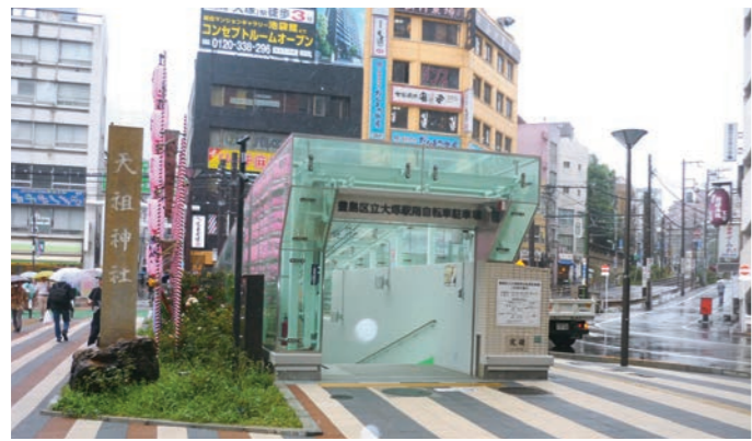
天祖神社と駐輪場入口

*大塚駅周辺は、昭和初期からの花町として栄え、今でも料亭が残っている路地に入ると何処かで三味線の音が聞こえる音が残り、「東京大塚阿波おどり」や「おおつか音楽祭」「大塚ハラまつり」など個性的な祭りやイベントが開催されています。 *大塚駅周辺には、さらに「アパホテル山手大塚」が2019年8月に開業予定となっております。大塚駅がさらに変わって行きます。 （文責25期A組 谷）