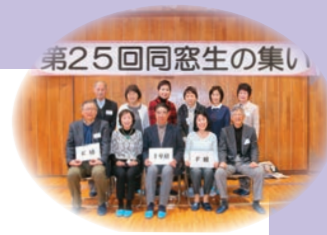
第25回同窓生の集い