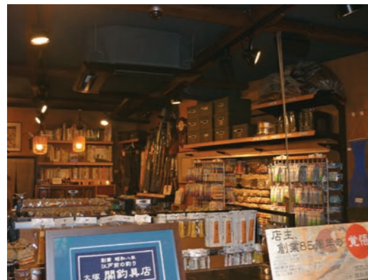
店舗入口より店内風景

3年間が、私の人生が、愚直で真摯な行動がなければ水は入れられない事を、この3年間で経験したように思えるのです。卒業後、大学でも社会人になっても常にこれを意識して行動してきました。これが文京高校の3年間が、私の人生