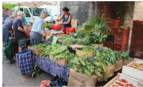
野菜やハーブのスタンド。ここでは紫蘇の葉が売られて居てとうとう自分で紫蘇を作らなくなってしまいました。プロにはかないませんから。