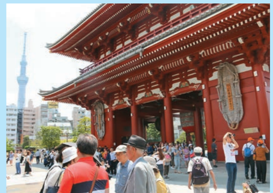
スカイツリーと小舟町の門

6月2日土曜日に、催事部の集いとして浅草見学を開催しました。当日は同窓会メンバーなど総勢13名の参加者が集まりました。気温は高かったものの、湿度はさほどではなく快適な見学日和となりました。