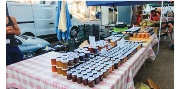
アルソーの市場のジャム屋のスタンド。彼らは自分の果樹園で果物を栽培し、それをジャムに加工して此处で売っています。自分では作れない物も売っているので私も時々お世話になっています。クレープを作った時とても重宝しています。

るつもりでした。所が一年後、もっと勉強したいという欲が出てしまったんですね。希望は叶えられましたが、帰る機会は逸して仕舞いました。元々健康ではなかった夫が移住三年の後に腎臓癌を発病、一年半の闘病後亡くなってしまったのです。外国で八歳と六歳の子供二人抱えて未亡人になるという劇的な体験をした時、其の儘南仏に住み続ける決心をしました。子供達の将来を見据えて高等教育はこの国で受けさせようという選択をしたのも理由の一つです。此処ではバカロレアを通れば日本での様に受験戦争などに巻き込