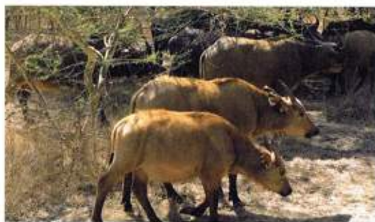
アフリカ旅行にて

「Love and Hate」は私にとつてのニューヨークだったが、タイはまさしく「Hate and Respect」と呼ぶにふさわしい場所である。だから私はタイが嫌いでもうしようもないが、敬意を払い感謝の気持ちだけは忘れられないようにしている。