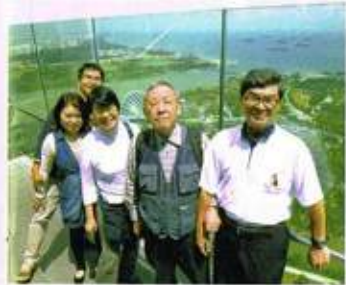
マリーナベイサンズホテルの屋上

タイは 国土は日本の約1.4倍の51万km 2 あり、人口6、100万人になります。農産物、特にお米が多く取れ、豊かな土地に恵まれ、外資による自動車産業など工業部門が拡大してきてアジアのデトロイトのような発展を遂げています。自動車の販売は1年間で120万台を超え、生産台数は250万台に達しています。その首都であるバンコクは近世都市として生まれ変わってきています。1961年、18歳の春に、母校を卒業してプラントエンジニアリング会社に入