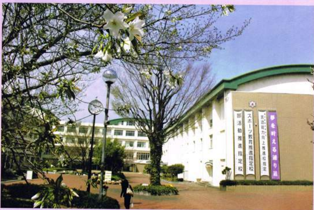
平成26年3月撮影。中央の樹は上の樹の今の姿です。