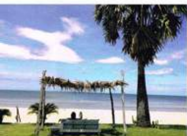
プランプリーのビーチリゾートにて

最初の1ヶ月は日本食屋とは異なる物珍しい環境を楽しみ、大学の新学期が始まるまではできるだけ寝こつと休まなく働いた。 しかし働き始めて二ヶ月ほど経ち、まかないのタイ料理にも飽き始めたこ