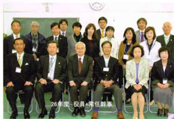
26年度 役員・常任幹事