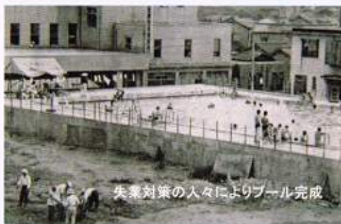
災害対策の人々によりプール完成

今の校舎は3代目です。 最初の校舎は空襲で焼けました。文京高校は、昭和15年に「第三東京市立中学校」としてこの大塚(当時豊島区西巣鴨3の858)の地に産声をあげました。東京市は市立中学校を三校作りしました。第一中学校は都立九段高等学校で今は十代田区立九段中学校になりました。靖国神社がそばに有り災害時の避難場所として意識して造ったと聞きます。文京の兄弟校です。第二東京市立中学校は今も都立