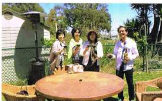
カリフォルニアの自宅で家族とともに

です。知り合いから、上場する会社があるから投資してくれ、と言われ、自分の友達や母親にも勧めて3億円近くも投資した挙句、逃げられたこともありました。よくある悪循環で、騙されてお金を失つと、次でその負けを埋めようとして、無理してしまうものなのです。結局、大きな投資で3件も騙され、やつぱり棄して儲けるなんて出来ないのだ、と身をもって学びました。「高かった」ところではない、あまりにも「巨額な」勉強代でしたが