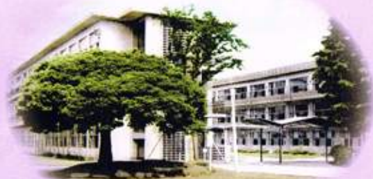
二代目校舎 (昭和42年撮影)