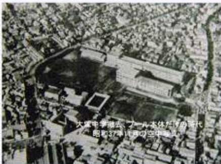
大塚中学校跡にプール建設(昭和37年)当時の空中写真

新制中学校はにわが作りを余儀なくされたため、空き地があればどこでも中学校にしました。そです。文京高校にも白羽の矢が立てられたのです。わが文京高校の敷地の南側の一角に豊島区立大塚中学校が間借りすることになりました。丁度、戦災で校舎を