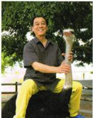
アフリカ旅行にて