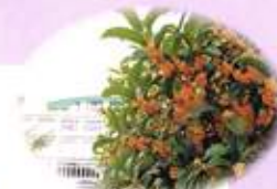
金木犀 (在り葉…謙虚)