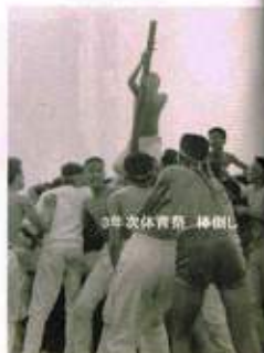
文化祭体育祭 同劇