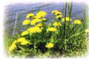
西洋タンポポ (花言葉-真心の愛)