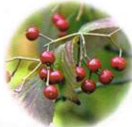
コバノガマズミの実 (花言葉…私を無視しないで)