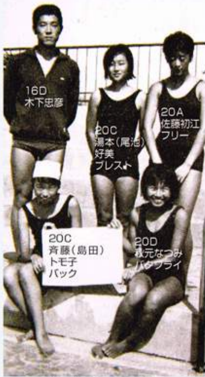
豊島区民大会（1966年）200メドレー 優勝

水泳部員にとつて忘れられない体験が特別活動（略して特活）です。学校週五日制が月1回の割合で導入される前の時代には期末試験終了後に約1週間通常授業がない特別活動期間があり、球技大会などが行なわれていました。水泳部などの部活動に所属する部員達はこの期間中一日中部活動に動きました。19期、20期生はこの時、学校