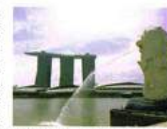
3代目のマリーナベイサン

社して石油工場、化学工場建設に関連するOJTを受けました。1966年6月、23歳から24歳まで韓国ウルサン市、馬山市の化学肥料工場建設の現場事務担当として派遣されました。世界銀行が資金提供の大型プロジェクトで初の海外勤務でした。1967年6月、24歳から25歳まで川崎市にて合成ゴム工場建設の事務並びに資材担当でした。1969年6月14日、26歳から28歳の時、シンガポール国に建設される、当時世界最大の石油精製工場建設に赴任。羽田空港を朝8時に出発して、台湾、香港、クアラルンプール、マレーシアを経由して13時間後に夜のシンガポールに到着。当時の飛行場ターミナルは平屋で倉庫の様な粗末なものでした。東京から2300KM南方の島国、都市国家シンガポールは琵琶湖大の約450平方キロ、300万人弱の人口でした。中国系、マレー系、インド系、欧米系等本当のミックス構成で、一人当りの所得は月2万円程度の発展国家でした(年US $8,000程度)。現在、大型理工工事を推進して、国土面積は約700平方キロに拡大、人口は550万近く、所得は日本を上回るUS $55,000です。日本はUS $44,300。赤道直下、常夏