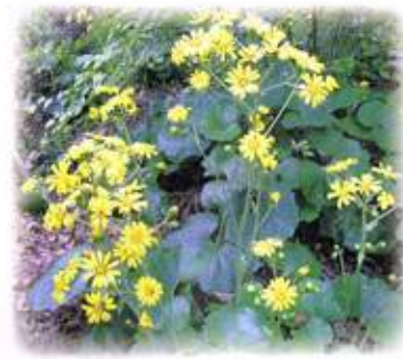
石菖 (花言葉: 謙遜)