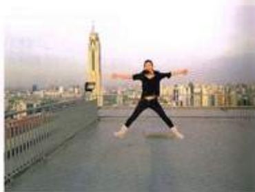
バンコクのランドマーク、パイヨーク・タワー

る、私はタイ人気質をほぼ完全に理解した。その店はまさに「Chaos」そのものだった。Chaosの元凶はタイ人オーナー自身であったと思ふが、それに相反して唯一の秩序でもあったのが彼の力率的存在だった。彼を嫌う従業員は誰一人居なかった。私自身今でも彼を慕つ気持を抱いている。しかし彼は強盗の如く店のレジから現金をゴソリ奪つて賭博へと出かけて行くようなキャンブラーで、時には借金取りが店に来るから力ネ払つて」と従業員に告げた。すると、空っぽのレジの中身を見たイタリア人の嫁が「Where is my f..... money」と我々に詰め寄る有り様であった。 お陰でタイ人がすっかり嫌いになつたが、信頼できる同僚も居て、仕事は続けられた。そんな状態を二年間続け