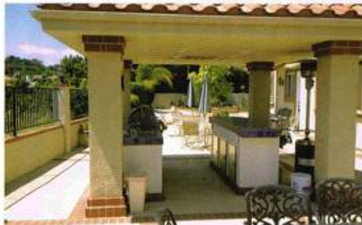
カリフォルニアの自宅

いろいろな悩んだ結果、思い切って会社を辞めて起業することを決めたのです。1988年11月のことでした。せつかく10年かけて、この地で築き上げたコネクションがあるのだから、これを無駄にする必要はない、と思ったんです。ずっと普通のサラリーマンだったので独立資金もなかったのですが、幸運なことに、かなりの額を貸してくれた方が出てきました。そのおかげで規模は小さかったのですが、社員3人でCHECKMATE KING CO. LTDというアパレルの輸出会社を始めることができました。