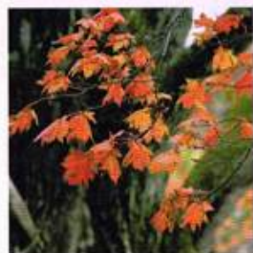
コハウチワカエデの紅葉