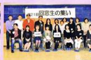
昨年の「同窓生の集い」は326名が参加しました。写真は当日の記念写真より。