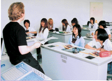
外人講師によるLL授業の風景