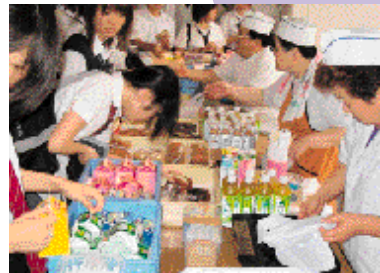
今は学校の向いにあるセブンイレブンが出張昼食販売。

元十秒台を記録）がいて関東大会に出場。一躍陸上部は有名になり、入部者も増えました。勉強のほうも、「陸上部は頭がいい」という伝統（笑）があり、同期も皆成績が良く、私も引張られて頑張れた気がします。