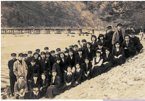
関西への修学旅行。車中泊だった。京都嵐山で。

櫻村 食堂は定時制の生徒用でした。その代わり、パン屋さんで学校前のセブンイレブンがお弁当を売りに来ます。