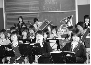
四月に行なう新入生歓迎会。吹奏楽部。