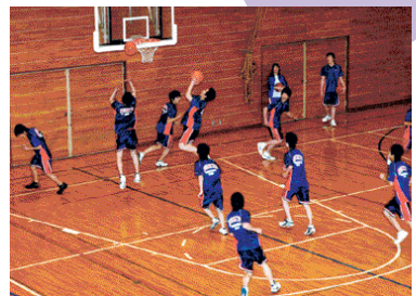
平成十六・七年度運動部活動推進重点校に指定され、部活は活発。

うという感じでした。勉強のレベルもそこそこで、部活も活発で、両親も文京にしたらと言つので受験しました。学区制が無くなりどこでも受験できたのですが、入学して判ったのですが両親や兄弟が文京卒業生だと言つ生徒が結構いますね。