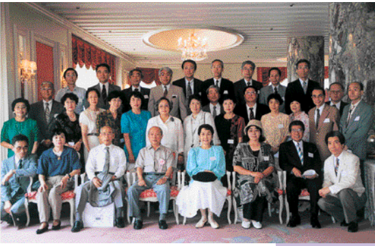
二十年前からオリンピックの年に7期同期会を開催。写真は第三回、新宿ホテルセンチュリーハイアットで。

トして、昭和二十七年六月に一部校舎が出来上がり三年生が新校舎に。全員が現在の新校舎に移転したのは十二月でしたね。いやあ、新校舎に移ったときは誇らしい気持ちでした。近代的な明るい校舎で、廊下には全員のリッカーがある。あの当時には考えられないことでした。モデルスクールの候補にもなった。ここからが、本当の文京高校の始まりですね、自分にとって。