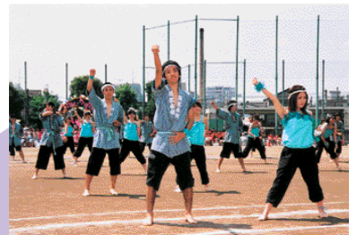
体育祭の最大のイベント、ダンス競技。

山添 男女共学といっても男子二百名、女子百名ですから男子クラスが二クラスできる。男女クラスでもクラス内で男女で話すことはありませんでしたね。休み時間は男女別々に分かれて。何せ「男女七歳にして席を同じゅうせず」(笑)の躰で育