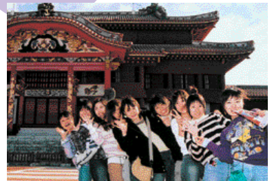
沖縄への修学旅行。グループで行動した。

つたものだから。でも学年に必ずマドンナみたいな女生徒が何人かいて憧れていましたね。そういうえば昔から好きで最近四七年ぶりに結ばれ結婚した同期カップルがいますよ。(十一頁)