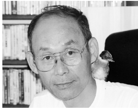
久しぶりに訪ねた文京の教員室で

Jリーグチャンピオンシップでヴェルディ川崎が鹿島を破り初代王座に ロサンゼルス大地震 リレハンメル冬季五輪で荻原健司らノルディック複合団体が2連覇 政治改革関連法が成立 細川首相辞任し羽田内閣発足。2ヵ月後に辞任。村山連立内閣がスタート F1サンマリノGPでアイルトン・セナ死亡 ユーロトンネル開通 松本サリン事件発生 サッカー・ワールドカップでブラジルが優勝 関西国際空港開業 第65代横綱貴乃花誕生 長崎巨人、西武を倒し初の日本一 流行語「同情するなら金をくれ」「こてこて」 映画「スピード」 レコード大賞「無言坂」