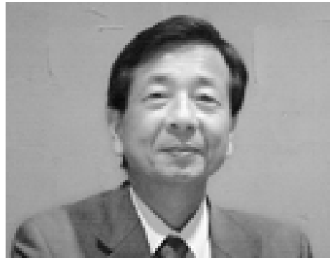
大塚駅前のレストランで

わりましたが、過日久しぶりに校門をくぐると大きな銀杏の木は健在で、楠も残念ながら、近年の雷で折れてしまったとはいえ、残っていて大変懐かしい空気を感しました。先生は、新校舎でも授業をされたのですか?