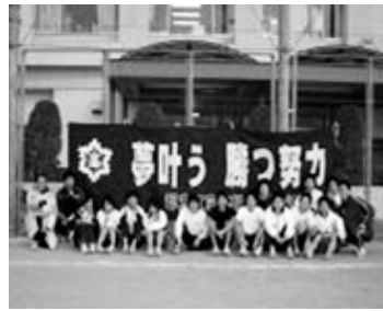
陸上部「夢叶う 勝つ努力」

宿を新潟県南魚沼郡湯沢で七月末から三泊四日で行い、三、十二月には通い合宿を行っている。