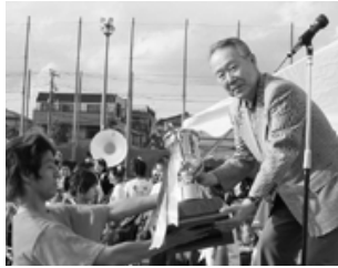
今年から優勝チームへ榎本同窓会長からトロフィーを授与。

体育祭優勝チームに 同窓会からトロフィーを 五月(五日水)快晴の五月晴 れのもとで、今年度の体育祭が開 催された。 A組～G組まで七の級団に別 れ、七級団の入場行進・開会宣言 などの後、九時過ぎから80m走や 集団演技、級団対抗リレーなど十 三の競技で競われ、接戦の末、F