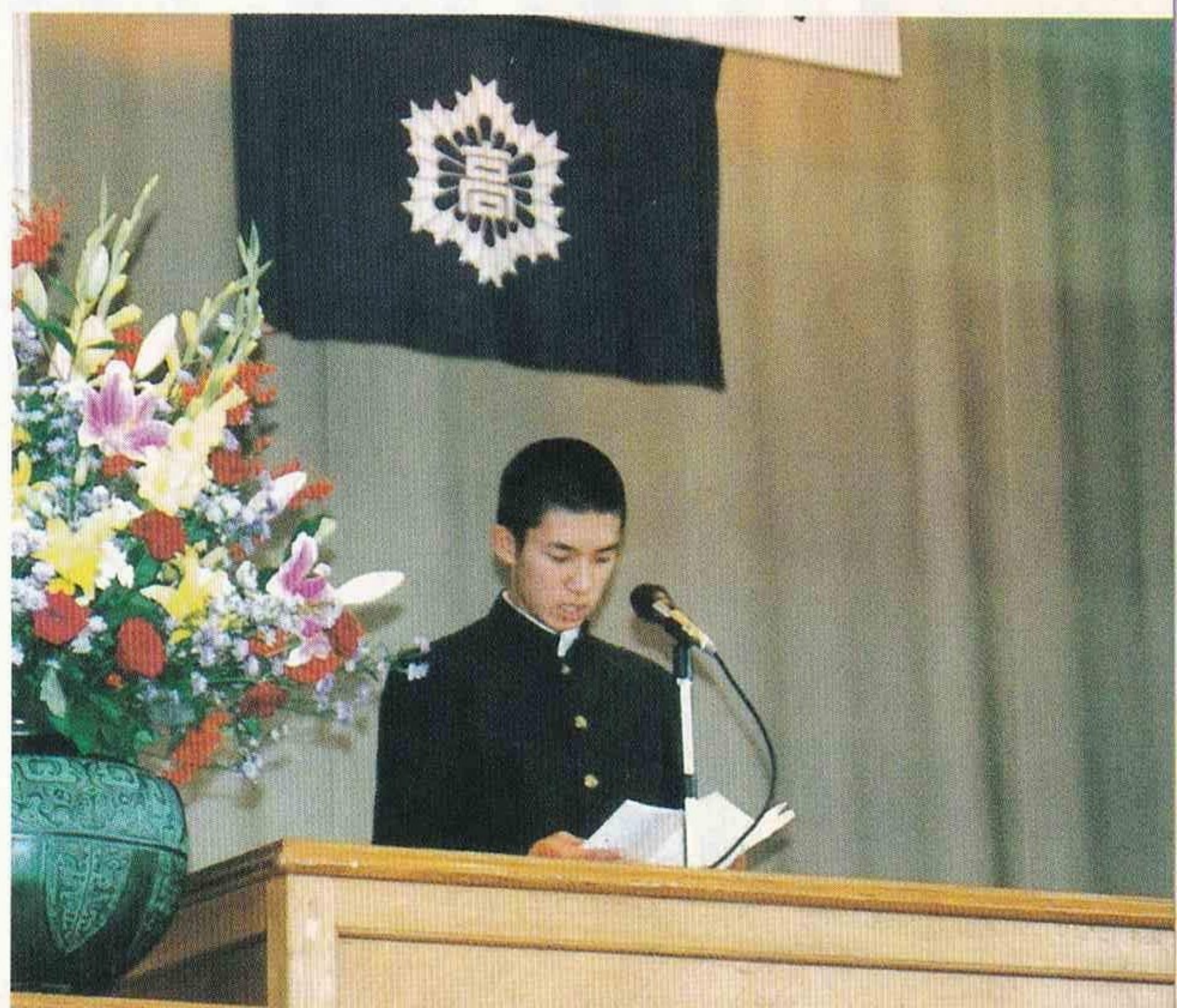
生徒代表のことは