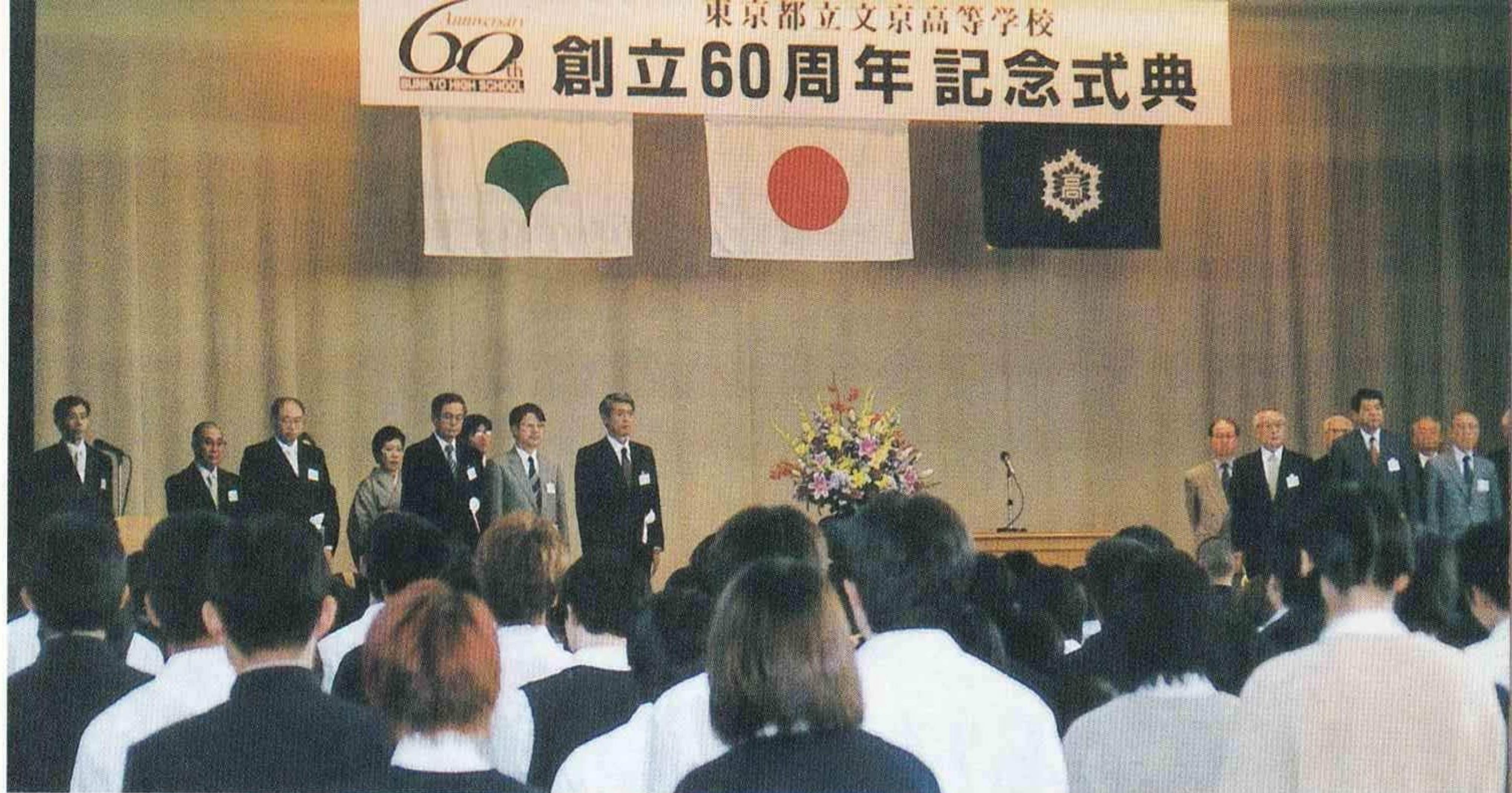
記念式典 開会の辞