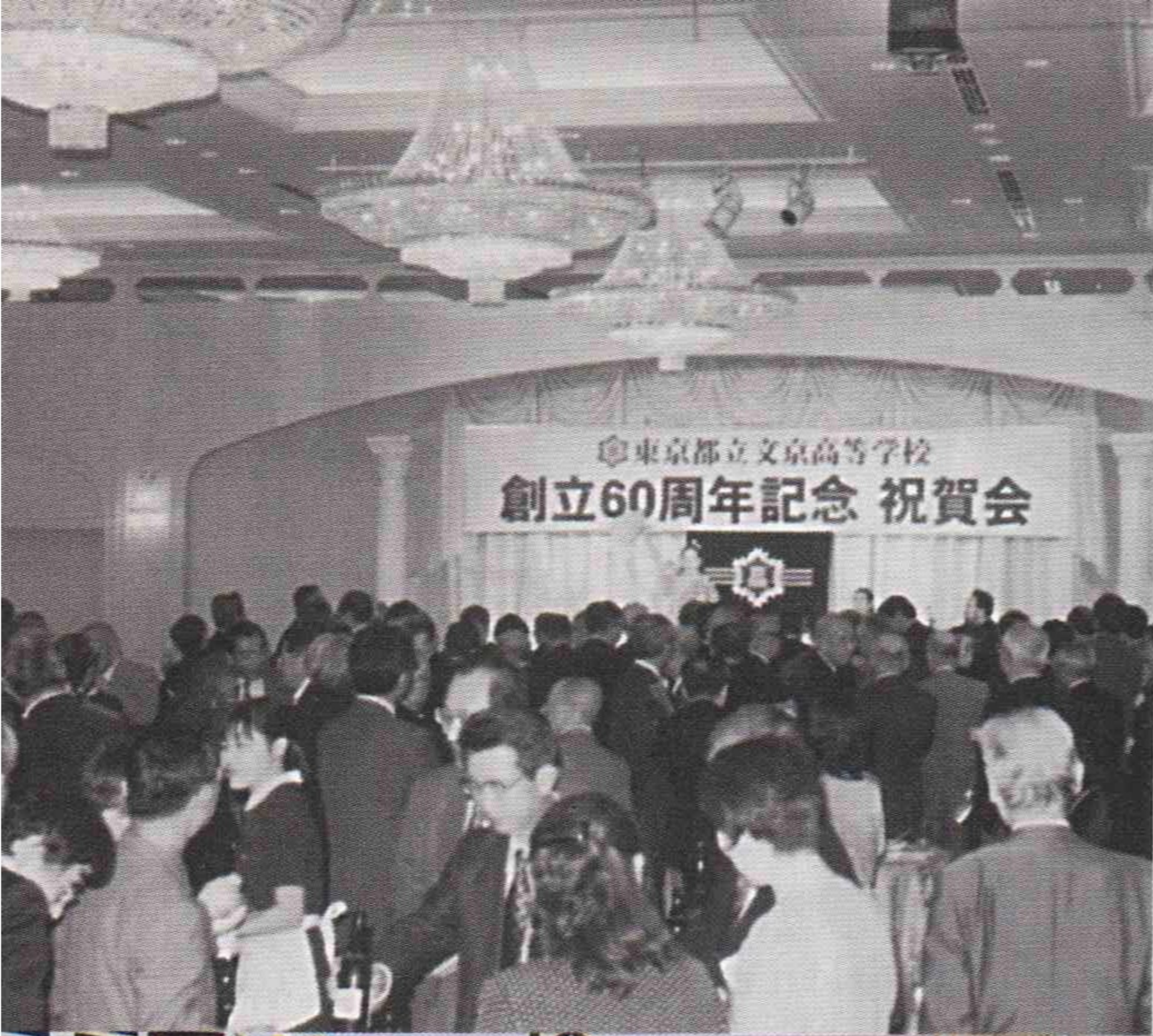
記念祝賀会 懇談風景