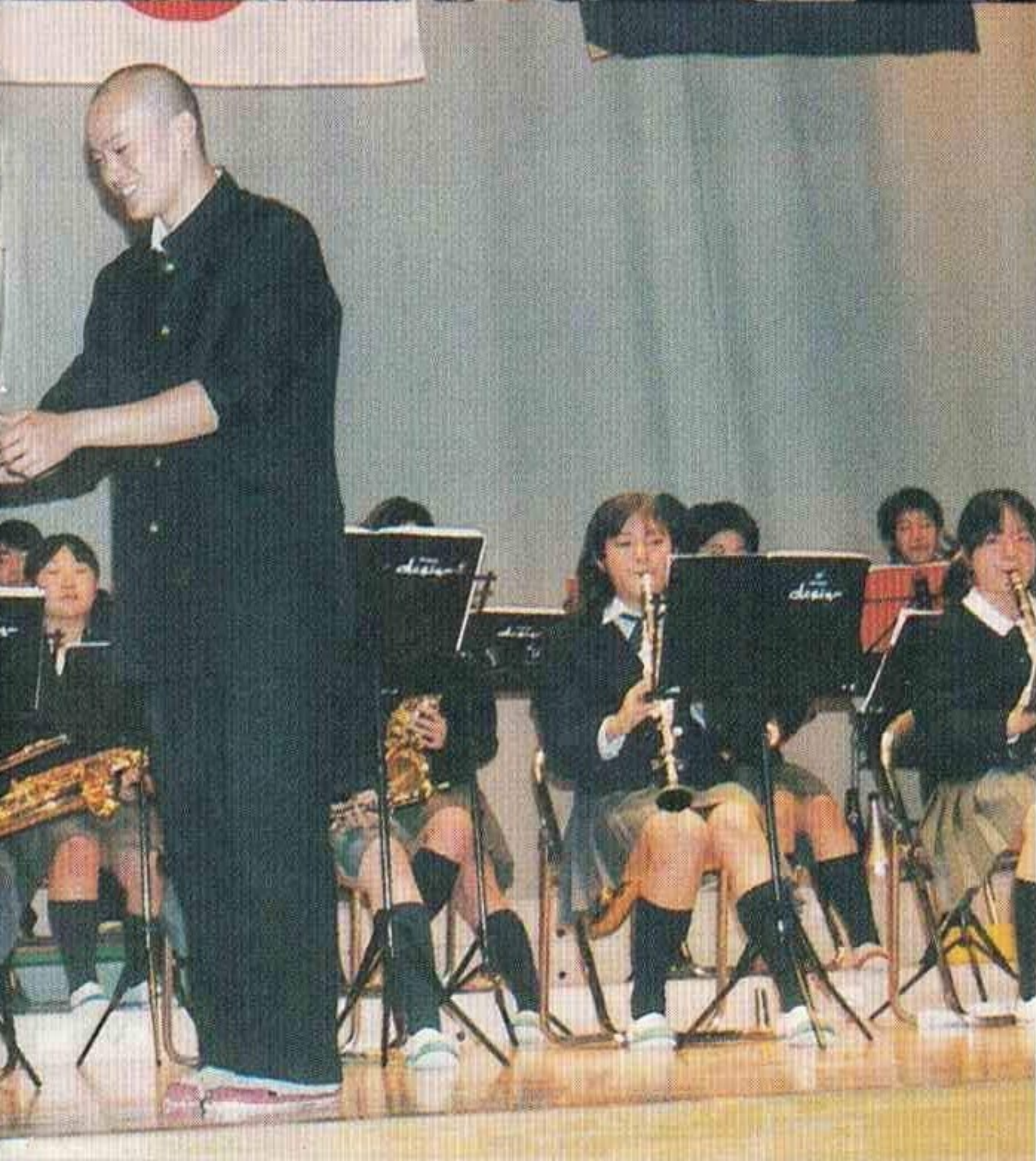
吹奏楽部演奏 タクトを引継ぐ静谷会長