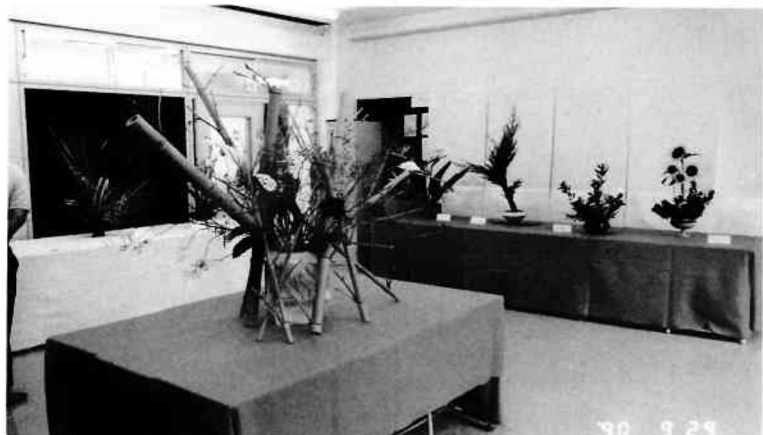
華道部 (古流松慶会)